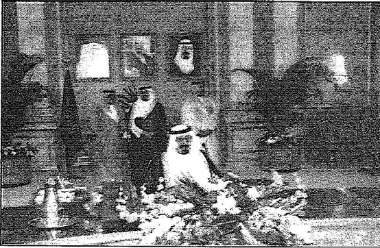
خادم الحرمين خلال ترؤسه جلسة مجلس الوزراء

وإلى الضرر البالغ الذي يتجم من ممارسة التميز والعنصرية بدعوى مكافحة الإرهاب. وأضاف وزير الثقافة والإعلام أن المجلس واصل بعد ذلك مناقشة جدول أعماله وأصدر من القرارات ما يلي: أولاً: وافق مجلس الوزراء على تشويش صاحب السمو الملكي وزير الداخلية (أو من ينوبه) بالتباحث مع الجانب البوسني في شأن مشروع اتفاقية تعاون بين حكومة المملكة العربية السعودية وحكومة جمهورية البوسنة والهرسك في مجال مكافحة الإرهاب والجريمة المنظمة والاتجار غير المشروع بالمخدرات والمؤثرات العقلية وتهريبها وذلك في ضوء الصيغة المرققة بالقرار والتوقيع عليه ومن ثم رفع النسخة النهائية الموافقة