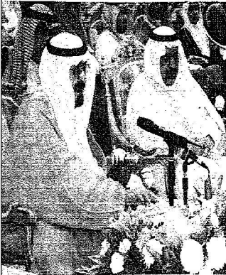
الملك يدشن إحدى المشاريع التنموية بالمنطقة

• القصيبي : ٥١٦ مليون ريال تكلفة المشاريع الفنية والمهنية • العنقري : ٤٠٠ مليون تكلفة المرحلة الأولى من جامعة الباحة