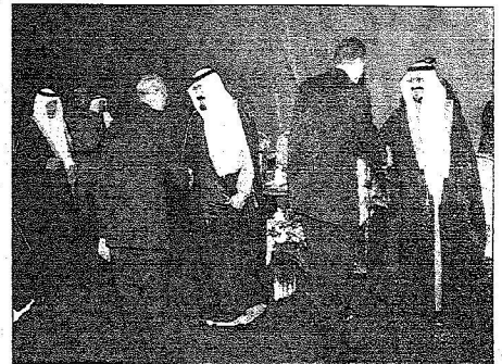
الفايزون السابطين يتشرفون بالسلام على الملك وولي العهد