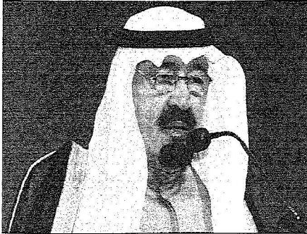
تصوير- صناديق الدوميني وميشغل التقدير