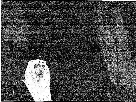
الأمير خالد الفيصل يلقي كلمة بهذه المناسبة