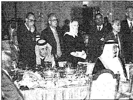
الأمير سلمان والأمير سعود الفيصل خلال الحفل