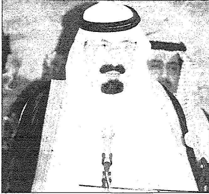
الملك عبدالله بنقي كمتي في الحقل المنب

وقال محالته: "إن من نعم الله الكبرى على المسلمين في العصر الحديث قيام المملكة العربية السعودية وتسخير إمكاناتها لخدمة الحرمين الشريفين وزوراهما وخدمة قضايا المسلمين في مختلف الأزمنة والأمكنة والمناسبات".