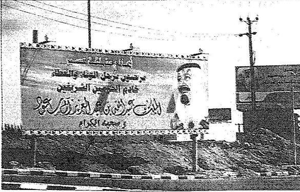
لافتة ترحيبية بالملك