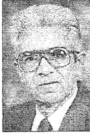
حسن فتح الباب

سواء ثقافية أو سياسية أو دينية فالمملكة أصبحت رائدة للعالم الإسلامي عن جدارة واستحقاق نظراً لسرعتها ومقدرتها في تلبية كل المطالب العربية والإسلامية، ومن لم يزر المملكة ويشاهد ويتلمس مدى ما حققته من نهضة يخسر خسارة كبيرة، وبهذه المناسبة أتوجه بالتحية إلى كل الإخوة الأشقاء في المملكة العربية السعودية وبشكل خاص أتوجه بالتحية لخادم الحرمين الشريفين الملك عبدالله بن عبدالعزيز ولا يسعني في هذه