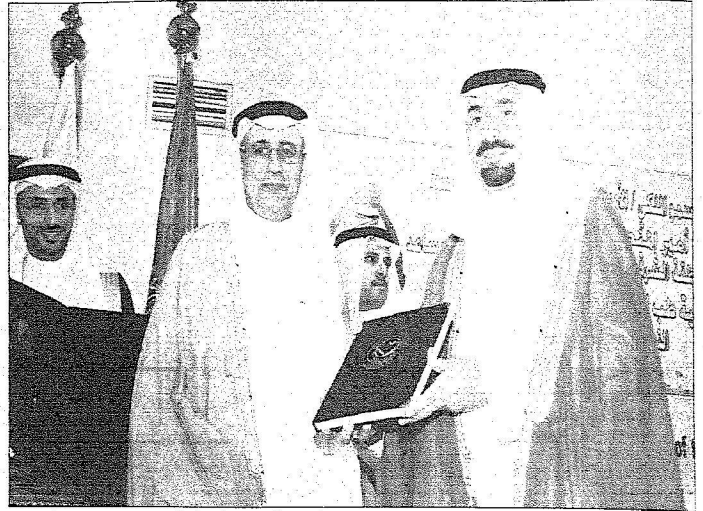
.. ويتعلم كتاب المحاضرات