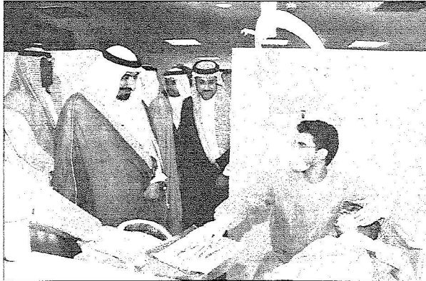
سموه في إحدى عيادات الأسنان