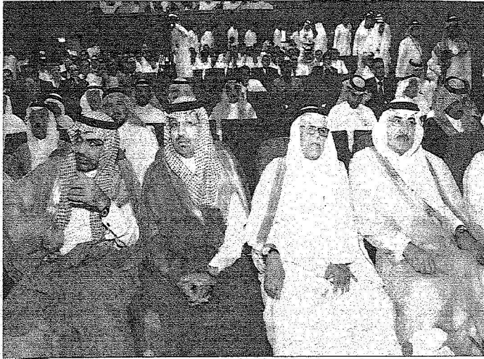
عدد من الحضور

التاريخ : 07-05-2008 العدد : 12745 الصفحات : 8 المسلسل : 50