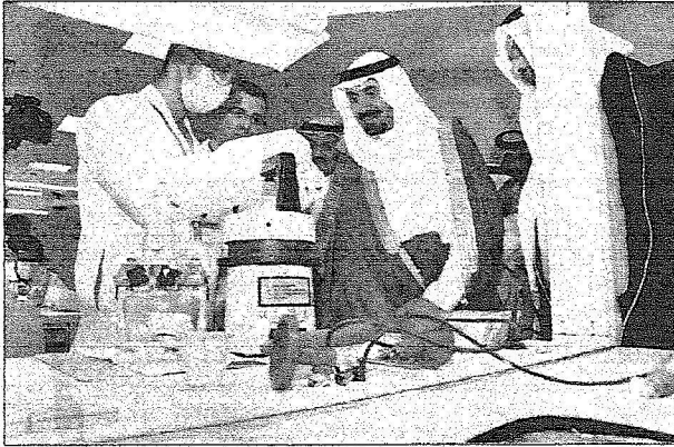
و يتفقد الأعمال