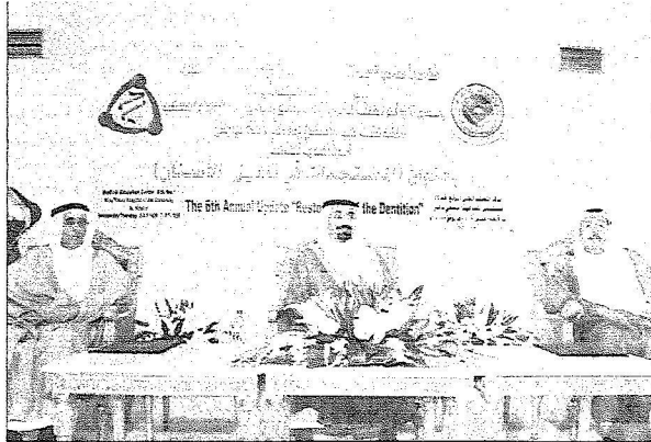
سموه في منصة الحفل

أضاف سموه: إن هذا يحتم علينا الحمد لله أولاً لآ أولى لهذه البلاد من نعمة ضافيه وهذه الكلية جزء من هذه النعم علينا والتي تعكس اهتمام وحرص سيدي خادم الحرمين الشريفين الملك عبد الله بن عبد العزيز وسيدي صاحب السمو الملكي الأمير سلطان بن عبدالعزيز ولي العهد وما يولونه من اهتمام للقطاعين الصحي والتعليمي سواء عبر ما سمعناه من اليزانيات أو الفوائض.