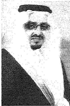
الأمير فيصل بن خالد