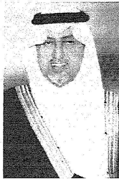
الأمير خالد الفيصل