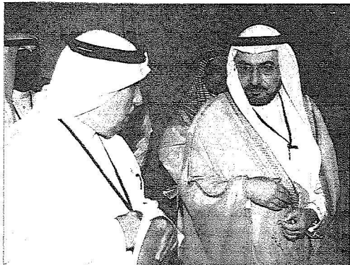
..ويتحدث للجاسر أثناء جولته بالقاعة الرئيسية