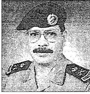
لواء خالد الطيب

سلطان الخير حقه وتصف ذلك الكرم في التواصل والعباء المستمر.. وما تكسبه منطقة القصيم من مشاريع خرجت اى الثور الا امتداد للعباءات التي اغرق سموه بها المنطقة.. ان هذه الزيارة مصدر فخر واعتزز حيث يلتقي الحاكم والمحكوم متيحاً سموه للجميع التعبير عن واعتزاز واهتماماتهم التي تحظى باهتمام خاص لدى قيادة وطننا الغالي ويؤكد سموه قوة اللحمة بين القيادة والشعب الذي يجدد الولاء والمحبة.. من خلال هذه اللقاءات.. ونحن نرثنا الله قيادة حكيمة زرعت فحصدت ان ما تعيشه مملكتنا الحبيبة من تطور واازدهار وما تمتلئه من نعمة وثروات ومقدسات نعمة حض الله بها هذه البلاد وتحتاج الى شكر فالشكر به اولاً ومن ثم الى قيادتنا الرشيدة ممثلة