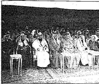
□ تصوير يشار بن عبدالله الخريش - يوسف القويان