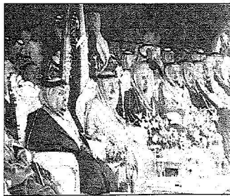
سموه في منصة الخط