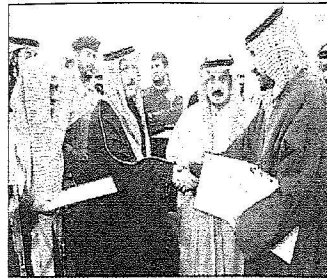
سموه يسلم أحد المستفيدين من المشروع