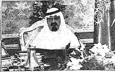
خادم الحرمين الشريفين لدى رئاسته الاجتماع