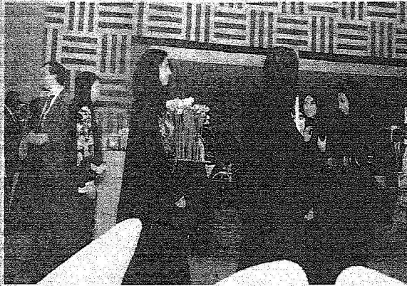
مشاركات فعالة في المنتديات الدولية