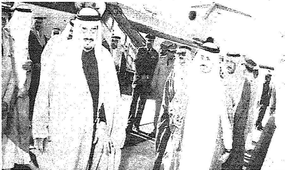
زيارة الملك فهد لتبوك عام 1408هـ.