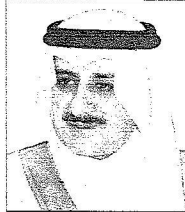
الأمير فهد بن سلطان

تجسدت في النهضة الحضارة التي تعيشها المنطقة في مختلف مناحي الحياة. وأضاف قائلا: "تسرفت منطقة تبوك بقبضة المناطق بزيارة خادم الحرمين الشريفين وولي عهده الأمين، إذ تحمل هذه الزيارة الكريمة في طياتها العديد من المشاريع التنموية التي تهدف إلى رفاهية المواطنين وتمتد نواحي الوطن في المجالات كافة".