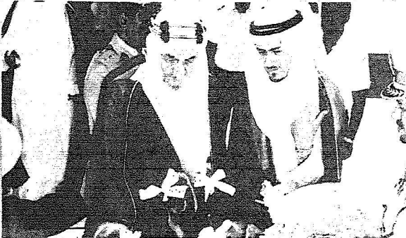
زيارة الملك فيصل لتبوك عام 1393هـ.