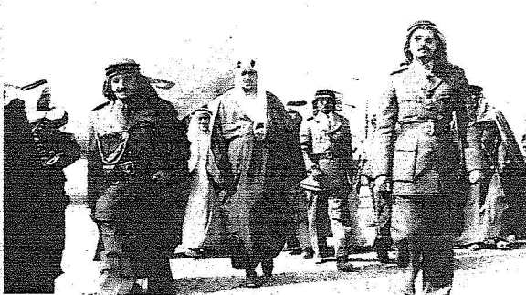
زيارة الملك سعود لتبوك عام 1373هـ.