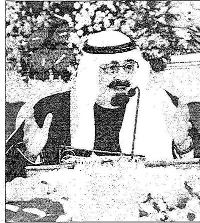
الملك خلال جلسة مجلس الوزراء أمس

وفي مستهل الجلسة، أطلع خادم الحرمين الشريفين المجلس على عمل اللقاءات والاتصالات والتي أجراها أيده السع قادة الدول الشقيقة والصديقة ومسؤولي الهيئات والمنظمات الدولية ومبعوثيهم، وخصوصاً لقاءاته حفظه الله بإخوانه أصحاب الجلالة والسمعة والسع قادة الدول العربية في دولة الكويت، خلال انعقاد القمة العربية الاقتصادية والتنموية والاجتماعية - قمة التضامن مع الشعب الفلسطيني في غزة - وكذا الاتصال الهاتفي الذي