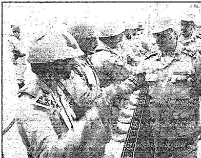
سموه يصافح قيادات الحرس الوطني

وقدر أرافق سموه خلال الجولة الفريق ركن متعب بن جوال الوابل رئيس الهيئة العامة للشؤون العسكرية بالحرس الوطني.