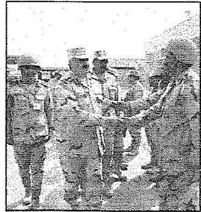
الفريق أول الركن متعب بن عبد الله متفقداً لواء الملك خالد