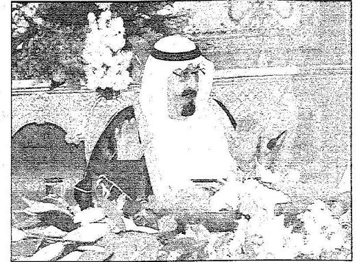
خادم الحرمين للشريفين يرأس جلسة مجلس الوزراء