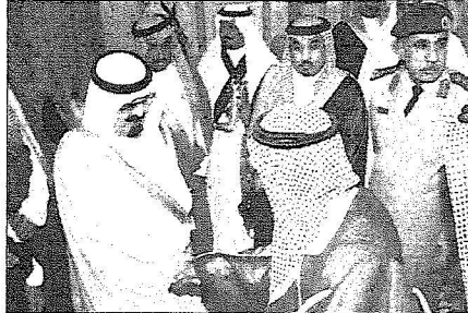
السنو وليد والوالمغني في الطائف أمس (داس)

من جانب آخر تشرف بالسلام على خادم الحرمين الشريفين الملك عبدالله بن عبدالعزيز آل سعود حفظته الله في قصره بالطائف أمس رئيس الاستخبارات العامة صاحب السمو الملكي الأمير مقرن بن عبدالعزيز يرافقه مساعد رئيس الاستخبارات العامة للتدريب اللواء يوسف الإبراهيمي وقائد مركز ومدرسة الملك عبدالله بن عبدالعزيز للأمن الخاص بالطائف العميد الركن أحمد بن سليمان المطلق وكبار قادة وضباط المركز والمدرسة وذلك بمناسبة تخريج مسمى المركز والمنبرسة من مركز ومدرسة الأمير عبدالله بن عبدالعزيز للأمن الخاص إلى مركز ومدرسة الملك عبدالله بن عبدالعزيز للأمن الخاص ومرور عام على ببيعة خادم الحرمين الشريفين حفظته الله. وقد تسلم الملك المغني خلال الاستقبال هدية تذكارية بهذه المناسبة من رئيس الاستخبارات العامة صاحب السمو الملكي الأمير مقرن بن عبدالعزيز.