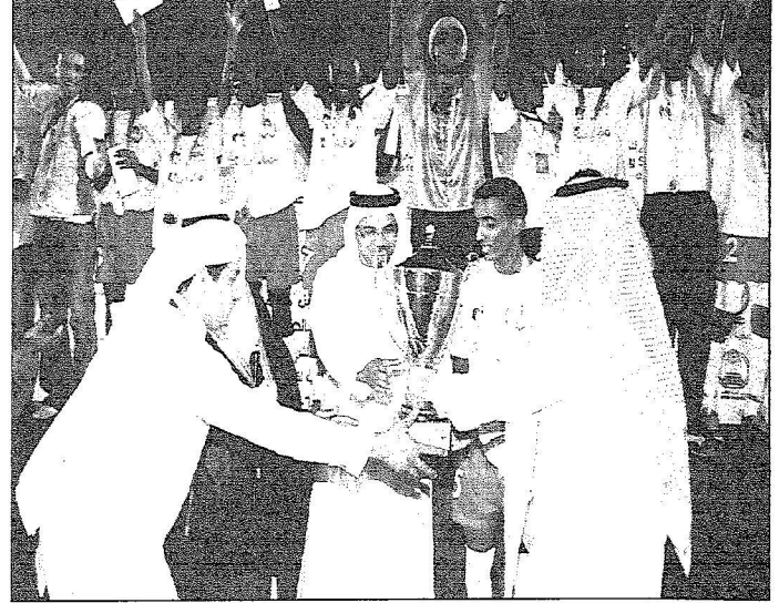
الكاف أثناء تكريم الفريق الفاضل بنجوي الدواس