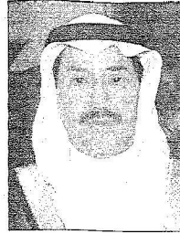
د. حدد المتع