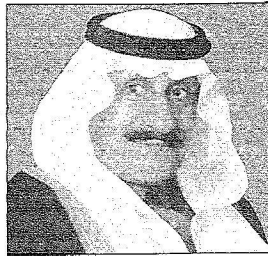
الأمير عبدالله بن عبدالعزيز بن مساعد