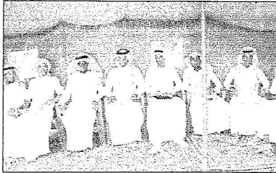
اشقاء الشهيد: تمنى الالتحاق بالقوات المسلحة لتسير على نوح شقيقنا