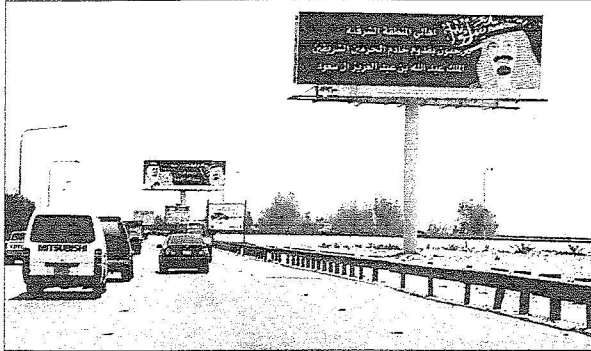
لوحات ترحب بزيارة الملك عبد الله للمنطقة الشرقية.