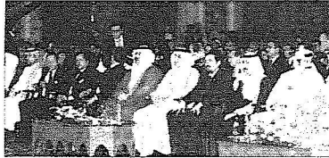
وجود وقيادات من كافة النواحل العربية في مؤتمرات المؤسسة