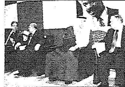
جانب من مؤتمرها المؤسسة في القاهرة