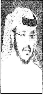
محمد بن صالح العثيمين

فيك شيء غير عن كل الملوك والعدا لو حاولوا ما ياصلوك وهامتك ترقى على كل الشكوك ولا يلام القادة اللي قدروك في الزعامة مالك كل الصكوك وارث إرث الفخامة من ابوك الوطن والدين دايم يشفلوك دايم تفرح قلوب اللي نصوك دمت يافخر العرب سيد الملوك باسم شعب وين مارحت تبعوك دوك روحي فدوة لك دوك دوك من هنا من نجد لئن أقصى تبوك كل شعبك يا بو متعب يعيشوك ينصرك ربي على من حاربوك