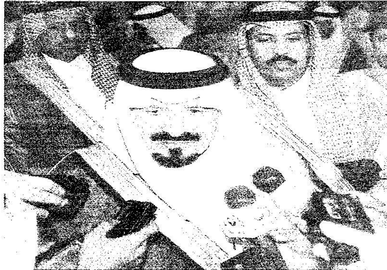
الامير سلطان خلال حديثه لوسائل الاعلام

ويزيل كل مشاكل بينهم حتى يكونوا مع مستوى المسئولية في خدمة دينهم ووطنهم. وحول تطوير مناهج التعليم العام قال سموه