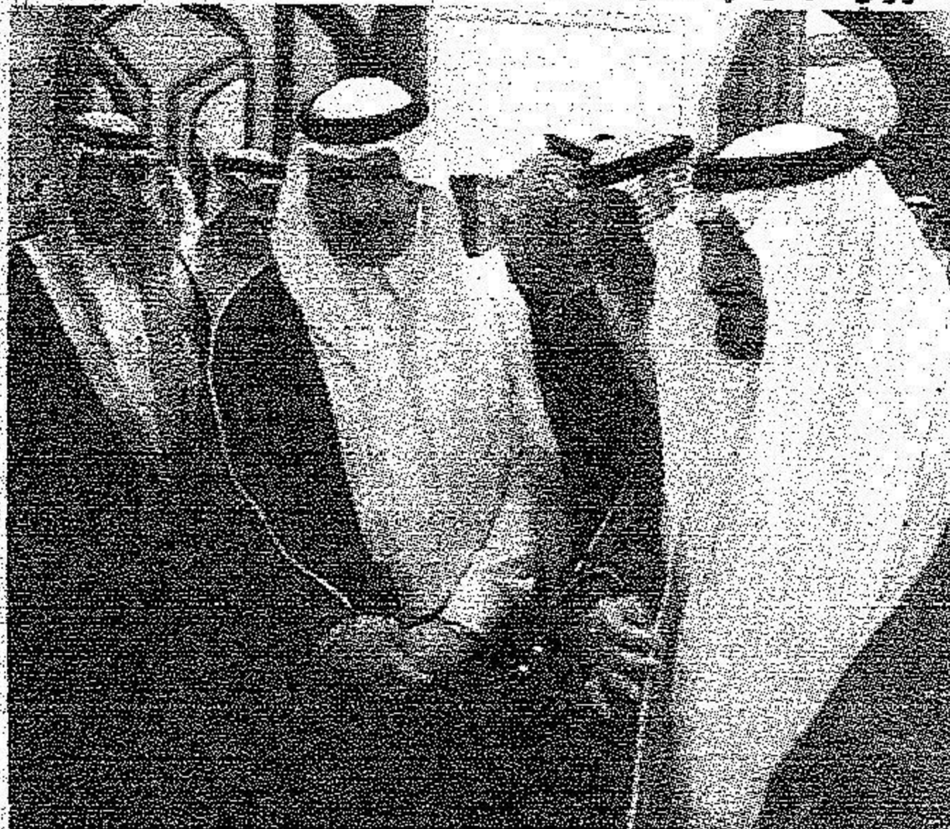
ويطلع على انجازات المؤسسة