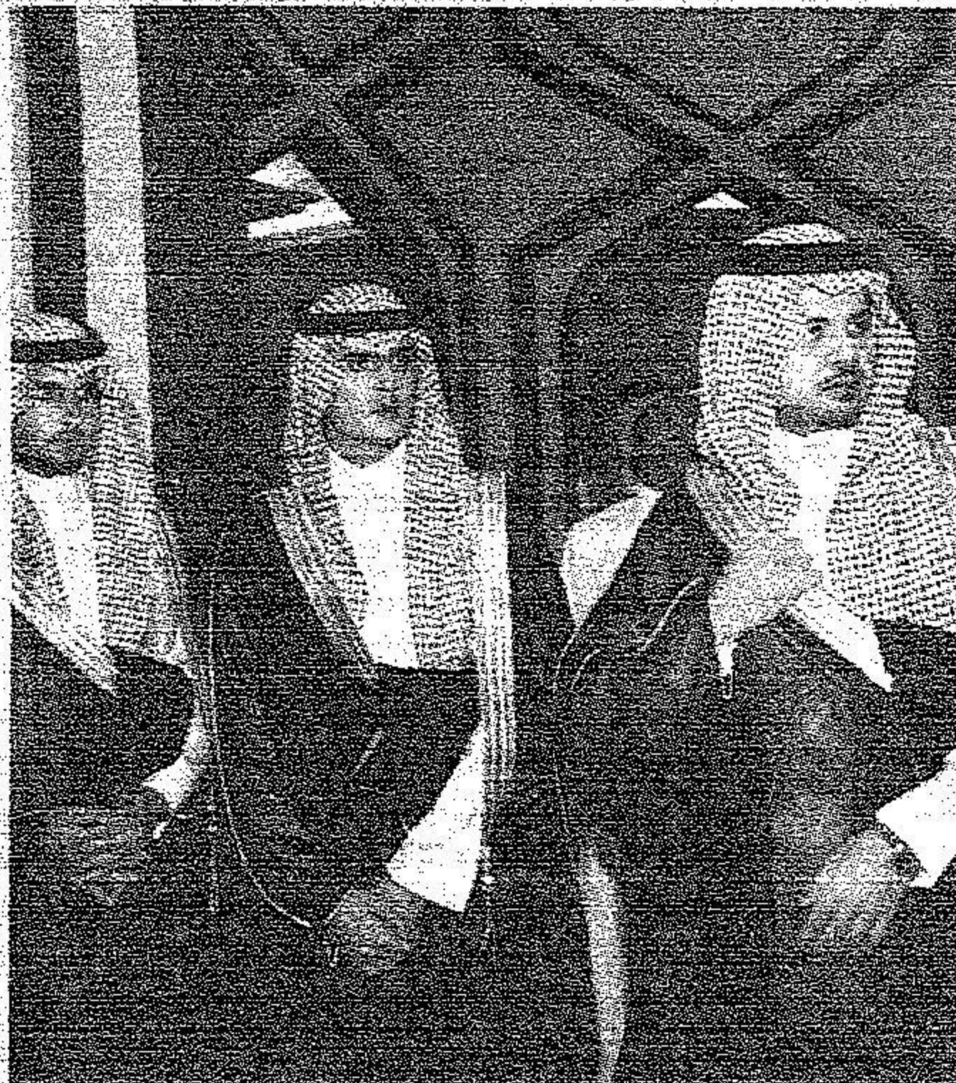
ابناء الامير سلطان في مقدمة مستقبليه