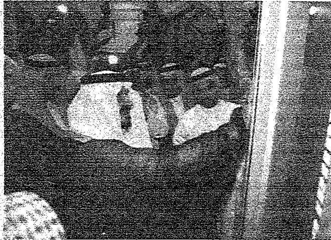
ويدشن عدد من المشاريع الخيرية

التاريخ: 2006-10-12 رقم العدد: 15877 رقم الصفحة: 5 مسلسل: 31 رقم القصة: 4