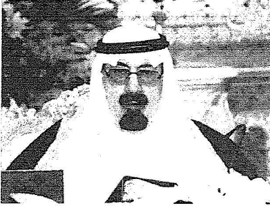
خادم الحرمين الشريفين خلال ترؤسه جلسة مجلس الوزراء في قصر اليمامة في الرياض

خادم الحرمين يدعو الله أن يحفظ ولي العهد من كل سوء وأن يسبغ عليه لباس الصحة والعافية وأن يعود إلى الوطن بأتم حال