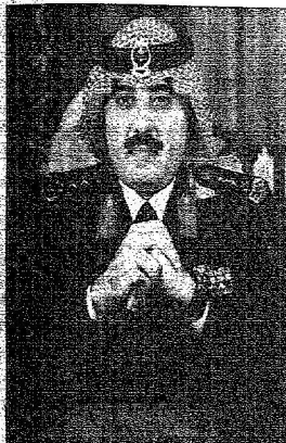
الأمير متعب بن عبدالعزيز

هذا هو الحرس الوطني السعودي، المؤسسة الحضارية العملاقة والقوة العسكرية المتجددة، يقف شاهداً حياً على قوة وشموخ ذلك الكيان الكبير المملكة العربية السعودية التي حققت في زمن وجيز تحت رعاية خادم الحرمين الشريفين وسمو ولي عهده الأمين ما لا يتحقق إلا في أمد طويل.