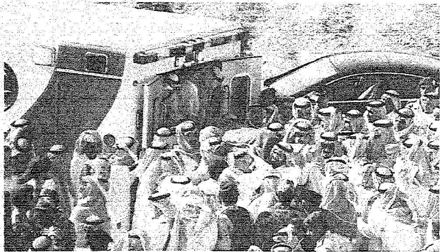
إنزال جثمان الفقيد من سيارة الإسعاف