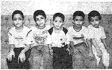
اطفال الرشيدي الصغار