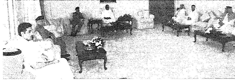
الأمير مقرن أثناء إجتماعه بقيادة تـ لـحج