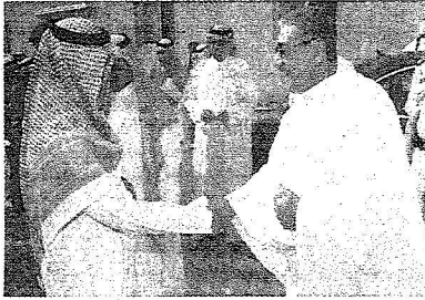
سموه خلال لقائه بالأمير المعبري