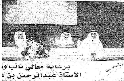
معالي نائب وزير الخدمة المدنية يفتتح اللقاء