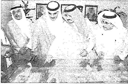
الأمير مشعل بن ماجد يتطلع على مجسم الصالات الجديدة .

والمع إلى أن الدولة راعت من خلا التقارير المعطيات التي قدمت للجهات المعنية والشكاوى ولاخفلت أن الطاقة الاستيعابية في الوقت الحالي صالات المطار تحتاج إلى تحسين فتم وضع إلى جانب مشروع تطوير المطار مشروع عاجل لتحسين الوضع القائم لاجل الانتقال للمشروع الجديد وتمت الموافقة عليه من قبل المقام السامي وتم اختيار