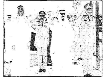
نائب خادم الحرمين لحظة وصوله مقر المؤسسة العامة للصناعات الحربية

اطلع على إبداعات الفنيين السعوديين ونموذج المدرعة "البنهارد" والعربة المدرعة الخفيفة