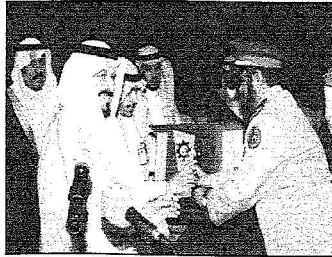
سموه خلال رعايته حال التخرج