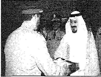
سموه يسلم شهادات الخريجين