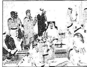
سموه مقرئاً اجتماع المؤسسة العامة للصناعات الحربية