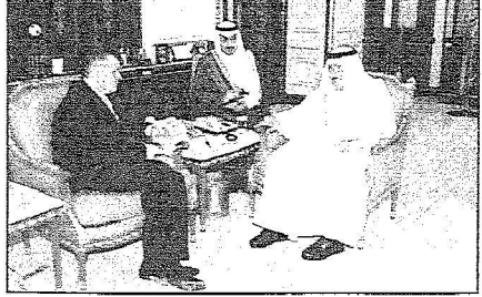
الأمير نايف خلال استقباله السفير السويدي