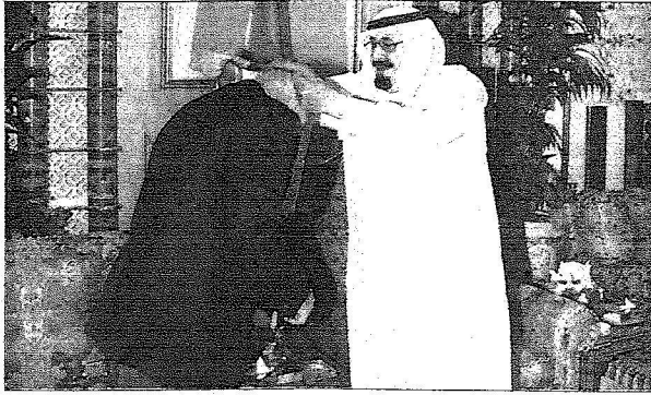
الملك يقدّم ويشاركه تشيبي ونجاح الملك عبد العزيز.

الأمير سعود الفيصل وزير الخارجية وعادل الجبير سفير خادم الحرمين الشريفين لدى الولايات المتحدة الأمريكية، وفورد فريكر سفير الولايات المتحدة لدى المملكة، ومدونين عن المراسم الملكية.