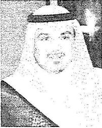
الامير عبد العزيز بن ماجد

بن عبدالعزيز للعلوم الصحية حول (خبرة المملكة في فصل التوائم السيامية وانعكاساتها الداخلية والخارجية). وقال ان الجامعة ستقدم مستقبلا ضمن فعالياتنا الثقافية العديد من المحاضرات والندوات والمؤتمرات والبرامج المتنوعة التي تخدم المجتمع المحلي وتناقش قضاياها : دون إغفال لرسالة الجامعة في خدمة العالم الإسلامي ؛ وقال ان هذه الجامعة العريقة التي تأسست عام ١٣٨١هـي إحدى الأشجار المنيرة التي غرستها حكومة المملكة وقطف ثمارها أبناء المسلمين في شتى أنحاء المعمورة حتى بلغ عدد خريجينا من مختلف المراحل الدراسية أكثر من ثلاثين ألف طالب يمثلون أكثر من مائة جنسية ، وقد عادوا إلى أوطانهم وخدموا مجتمعاتهم علماء وقضاة ومعلمين ودعاة إلى دين الحق بالحكمة والموعظة الحسنة . ونوه بالدعم اللا محدود من خادم الحرمين الشريفين الملك عبدالله بن عبدالعزيز وحكومته الرشيدة لهذا الصرح العلمي الشامخ ، وتلك دعم ومساندة صاحب السمو الملكي الأمير عبدالعزيز بن ماجد