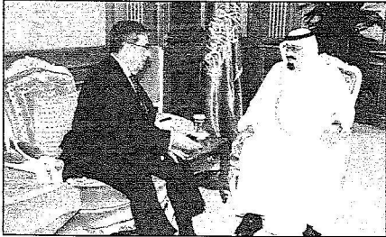
خادم الحرمين الشريفين يستقبل معالي الأمين العام لجامعة الدول العربية دواس