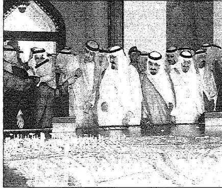
للكيك يطلع على مجسمات المشروعات والتي جواره الأمير مشعل بن عبدالعزيز