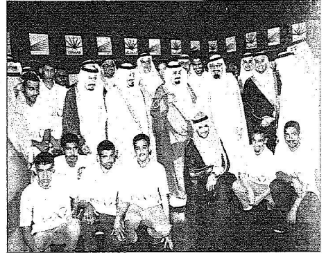
الملك في صورة تذكارية مع أعضاء الهيئة العامة للاستثمار