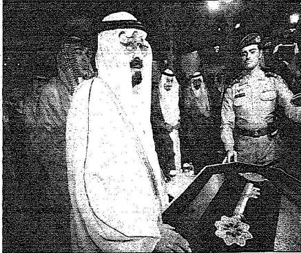
ويتسلم هيئة تنكارية من مؤسسة (كير) الإسلامية