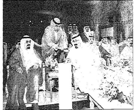
خادم الحرمين خلال وضعه حجر الأساس لعدد من المشروعات بمدينة الملك عبدالله الاقتصادية