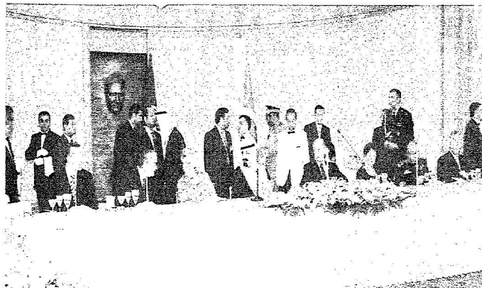
خادم الحرمين خلال حضوره مراسم حفل عشاء الرئيس التركي في قصر جاملي كشك في أنقرة