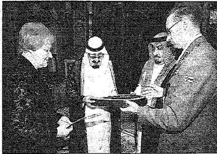
الملك يفتح فخامتها قلادة الملك عبدالعزيز