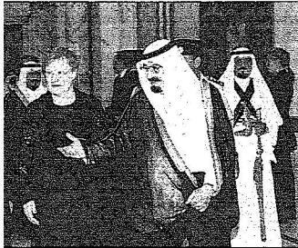
المليك يقيم حفل غداء تكريما للضيافة الفنلندية