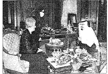
خادم الحرمين لدى اجتماعه برئيسة فنلندا

منحها قلادة الملك عبدالعزيز وتسلم وسام الوردة البيضاء لفلندا