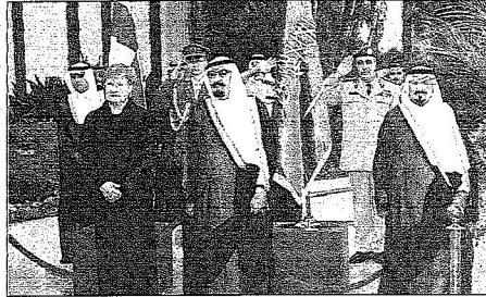
خادم الحرمين خلال استقباله فنماتها