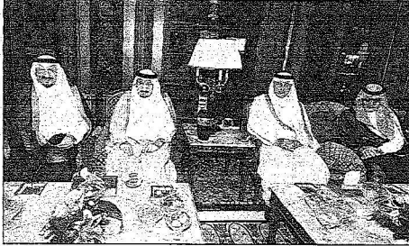
سوم ولي العهد وعدد من الأمراء خلال الاستقبال

السمو الملكي الأمير خالد بن عبدالله بن عبدالعزيز وصاحب السمو الملكي الفريق أول ركن متعب بن عبدالله بن عبدالعزيز نائب رئيس الحرس الوطني المساعد للشؤون العسكرية وصاحب السمو الملكي الأمير مشعل بن ماجد بن عبدالعزيز محافظ جدة وصاحب السمو الملكي الأمير منصور بن ناصر بن عبدالعزيز مستشار خادم الحرمين الشريفين وصاحب السمو الأمير الدكتور بندر بن سلمان بن محمد آل سعود مستشار خادم الحرمين الشريفين وصاحب السمو الملكي الأمير سعود بن عبدالله بن عبدالعزيز وصاحب السمو الملكي الأمير محمد بن عبدالله بن عبدالعزيز وأصحاب السمو الملكي الوزراء وكبار المسؤولين من مدنيين وعسكريين عن الخطبة الثالثة أمس