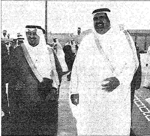
حديث باسم بين الشيخ حمد وولي العهد.