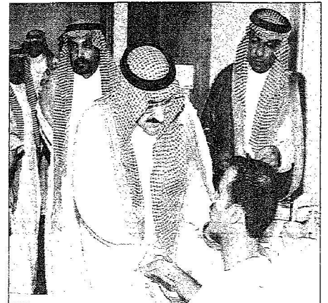
الأمير محمد يصفح لحد المصابين من رجال الأمن