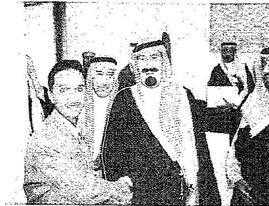
خادم الحرمين الشريفين في طوكيو ٢٣ أكتوبر ١٩٩٨م