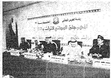
جانب من المؤتمر الصحفي

◆ السبت : مقاطعة الهرجان من قبل الداعوين غير واردة وضيوف الهرجان يفوقون ٦ آلاف ضيف