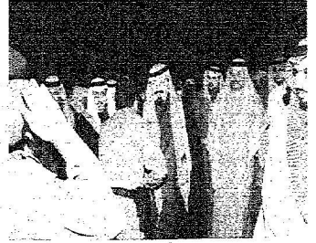
خادم الحرمين لدى وصوله روضة خريم