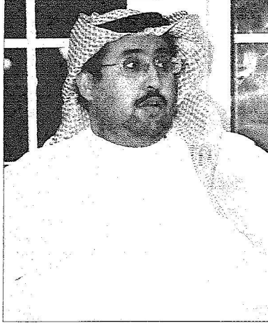
رياضنا محل اعزازنا