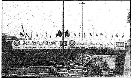
شوارع مدينة الرياض استعدت لتوصل القمة