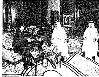
خادم الحرمين لدى اجتماعه بالمعامل الأردني