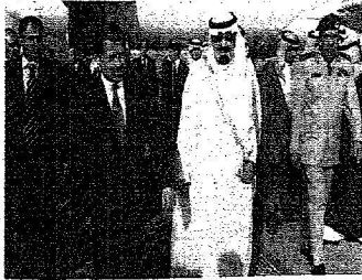
ملك خلال استقباله السيد الأردني لدى وصوله جدة