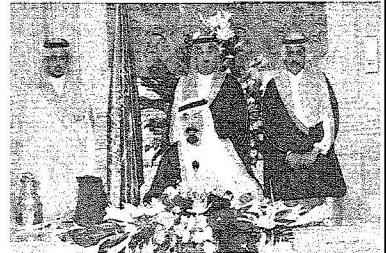
خادم الحرمين لدى ترؤسه جلسة مجلس الوزراء

الموافقة على ترخيص تأسيس جبل عمر للتطوير كشركة مساهمة وطرح أسهمها للاكتتاب خلال ثلاثين يوماً