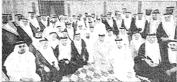
خدام الحرمين الشريفين في لحظة جماعية مع المشاركين في اللقاء الوطني السابع خلال استقباله لهم أمس.